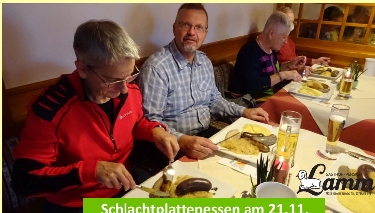
Schlachtplattessen am 21.11.