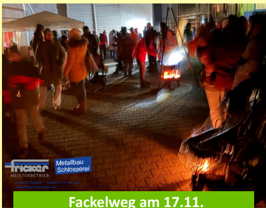
Fackelweg am 17.11.